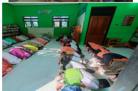
Gambar 5 Kegiatan Tadarus al Qur'an, BTQ, dan Shalat Dhuha

SDN Karangtengah Prandon 2 menerapkan profil pelajar Pancasila berdasarkan wawancara dengan kepala sekolah dan guru kelas IV. Pada 21 Mei 2024, peneliti mewawancarai tiga siswa kelas IV selain kepala sekolah dan guru kelas IV. Dari wawancara yang dilakukan, peneliti memperoleh informasi sebagai berikut: