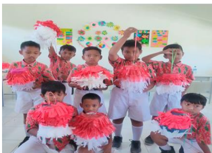
Gambar 8 Hasil Kerajinan P5

Selain mewawancarai kepala sekolah dan guru kelas IV, peneliti juga mewawancarai tiga siswa kelas IV pada 21 Mei 2024. Berdasarkan temuan wawancara dengan NC, peneliti menemukan informasi berikut: