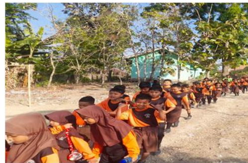
Gambar 6 Jalan Sehat SDN Karangtengah Prandon 2

“Untuk kebijakan lima hari sekolah saya menganjurkan wali kelas menggunakan fasilitas sekolah berupa LCD proyektor, sound system, dan laptop jika dirasa siswa sudah mulai bosan. Serta mengalihkan jam mata Pelajaran menjadi P5 dan di hari Jum`at diadakan jalan sehat selama 2 minggu sekali.”