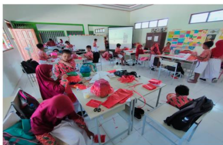
Gambar 7 Pembelajaran Menggunakan Proyektor