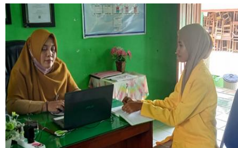
Gambar 1 Wawancara Kepala Sekolah SDN Karangtengah Prandon 2

“Pelaksanaan pembelajaran sesuai dengan Peraturan Menteri Pendidikan dan Kebudayaan RI Nomor 23 Tahun 2017, 40 jam pelajaran dalam satu minggu atau dapat dibilang 8 jam pembelajaran dalam satu hari atau dapat dibilang lima hari sekolah, lima hari sekolah di SDN Karangtengah Prandon 2 sudah berjalan sejak tahun 2022 sebelum saya menjabat sebagai kepala sekolah disini.”