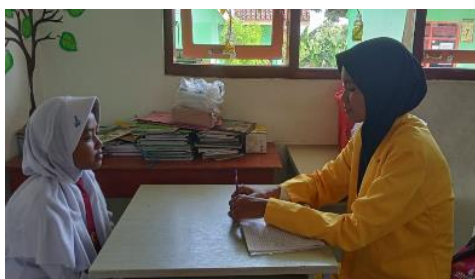
Gambar 3 Wawancara dengan siswa kelas IV SDN Karangtengah Prandon 2

“Sampai sore, pulang pukul 15.00. tetapi masuknya 5 hari dalam satu minggu”.