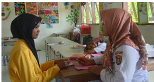
Gambar 2 Wawancara guru kelas IV SDN Karangtengah Prandon 2

khusus kelas IV-VI, kalau untuk kelas I-III 7 jam sehari, hal ini sejalan dengan peraturan yang berlaku”.