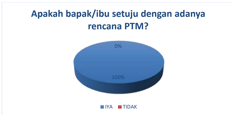
Gambar 1. Mengenai apakah responden setuju dengan adanya rencana PTM