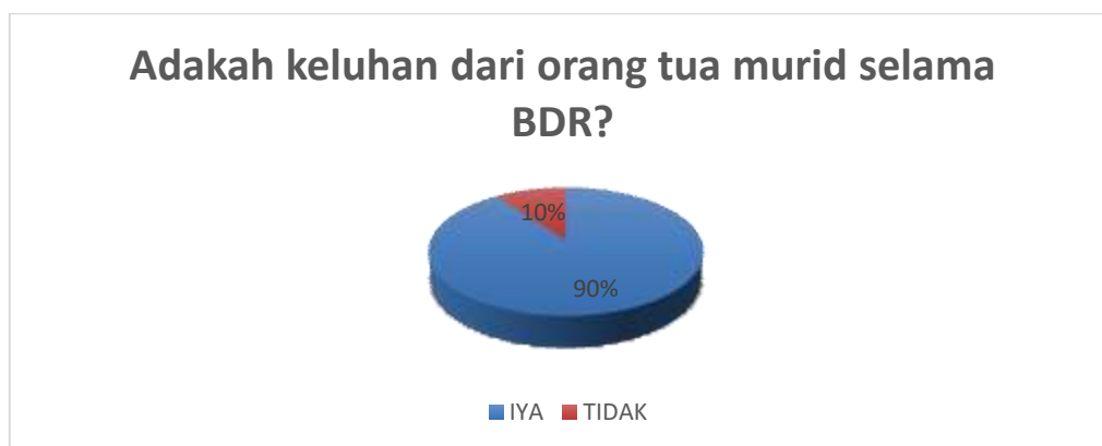
Gambar 2. Mengenai adakah keluhan dari orang tua murid selama BDR