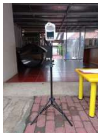
Gambar 5. Tempat cuci tangan di setiap pintu menuju kelas dan Standing thermo gun di gerbang depan untuk mengukur suhu tubuh