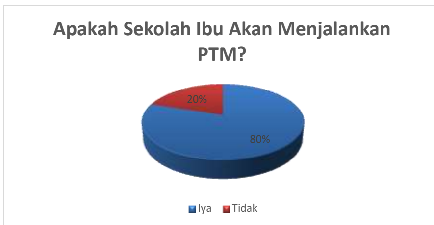
Gambar 3. Mengenai Sekolah Responden yang Akan Menjalankan PTM