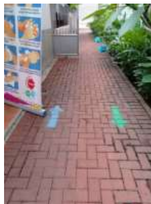
Gambar 4. Merupakan Tempat duduk yang diberi jarak dan Jalan menuju kelas yang diberi tanda penjaga jarak